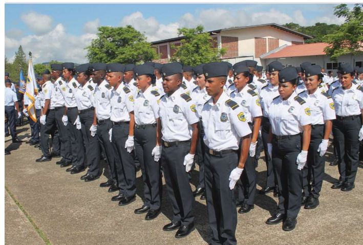
Aumento de unidades para cumplir con la seguridad migratoria.

Luego de ocho meses de preparación y capacitación en especialidades y temas migratorios, así como en tácticas policiales y todo lo necesario para cumplir el servicio de dar seguridad migratoria, resguardar las fronteras y otros puntos de control, 79 nuevos inspectores migratorios fueron juramentados a mediados del año, en una ceremonia realizada en el Instituto Superior Policial (Ispol) en Gamboa.