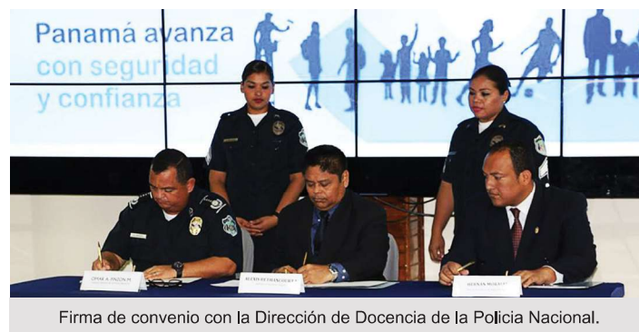
Firma de convenio con la Dirección de Docencia de la Policía Nacional.

Convenio con la Dirección de Docencia de la Policía Nacional de Panamá, para la capacitación de 4,000 uniformados en temas relacionados con la estrategia de policía comunitaria.