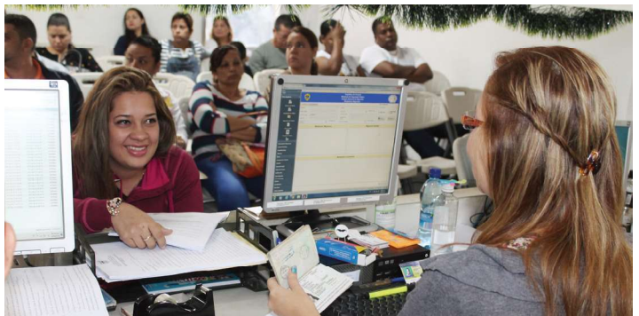
Funcionarios entrevistan a extranjeros para emitir permiso provisional.

Otro punto a destacar, es que los extranjeros son entrevistados y evaluados por colaboradores del SNM, para determinar si procede o no el otorgamiento del permiso provisional.