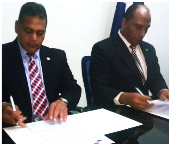
Panamá y Rep. Dominicana firman acuerdo para el intercambio de información.

El SNM y la Dirección General de Migración de República Dominicana firmaron un protocolo para el intercambio de información entre ambas entidades, con lo cual se reafirmó el objetivo de complementar lo establecido en el “Acuerdo sobre la implementación de un mecanismo de intercambio de alertas migratorias e información de seguridad”, suscrito el 1 de septiembre de 2015 entre los dos países.