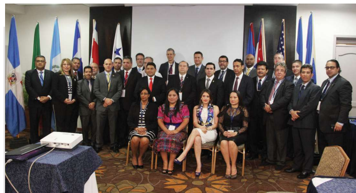
Comisión Centroamericana de Directores y Directoras de Migración.