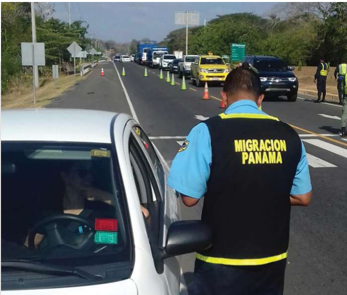
El SNM realiza operativos constantemente.

Las acciones de campo fueron reforzadas y en la mayoría de las veces se realizaron de manera conjunta entre funcionarios del SNM, la Policía Nacional y el Ministerio de Trabajo.