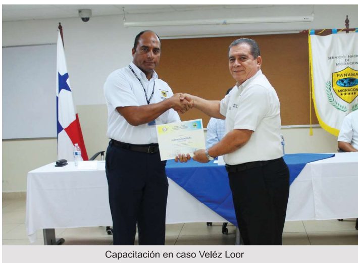
Capacitación en caso Veléz Loor

La sentencia del caso Vélez Loor, dictada el 23 de noviembre de 2010, estableció jurisprudencia internacional al convertirse en la primera sobre temas migratorios del continente.