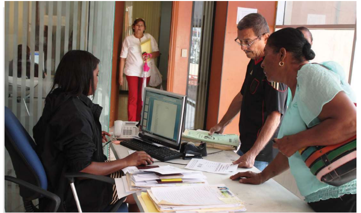
Extranjeros solicitaron permiso provisional de residencia.

Con la Regularización Migratoria General se dio inicio a la emisión, de un permiso provisional de residencia que fijará al final de cada año, el número máximo de extranjeros cuya situación podrá ser regularizada al año siguiente.