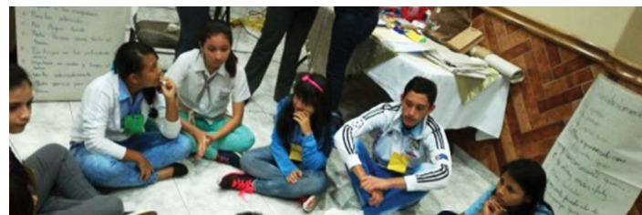
Jóvenes del programa "Juntos por una comunidad sin violencia".

Estudiantes de 36 colegios de Colón, David, San Miguelito y Panamá Centro son beneficiarios del programa "Juntos por una comunidad sin violencia", que desarrolla el Ministerio de Educación con el aporte del Programa Secopa, dirigido a la prevención de la violencia estudiantil y aumento de los niveles de inclusión social de los jóvenes, mediante la promoción y fortalecimiento de actitudes y valores.