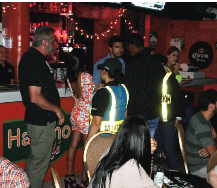
El SNM realiza operativos en locales comerciales.

Con la Regularización Migratoria General se dio inicio a la emisión, de un permiso provisional de residencia que fijará al final de cada año, el número máximo de extranjeros cuya situación podrá ser regularizada al año siguiente.