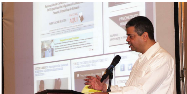
Presentación del Sistema de Prechequeo Migratorio.

El Servicio Nacional de Migración (SNM) cuenta desde este año con el Sistema de Prechequeo Migratorio, el cual da beneficios a viajeros nacionales y extranjeros que tienen interés de visitar Panamá.