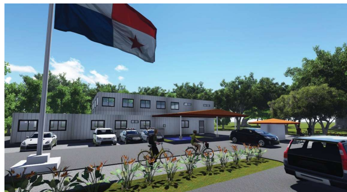
Ilustración de instalación modular para subestación de Policía Nacional

En proceso la construcción de infraestructura para la operación de la Unidad Preventiva Comunitaria en Samaria. Se fortalecerá la Dirección Nacional de Docencia de la Policía Nacional, su unidad académica y el Centro de Capacitación y Especialización Policial. Proyección panorámica del proyecto suministro e instalación de modulares para una subestación de la Policía Nacional para 52 unidades, ubicada en Samaria, sector 4d, corregimiento de Belisario Porras, provincia de Panamá.