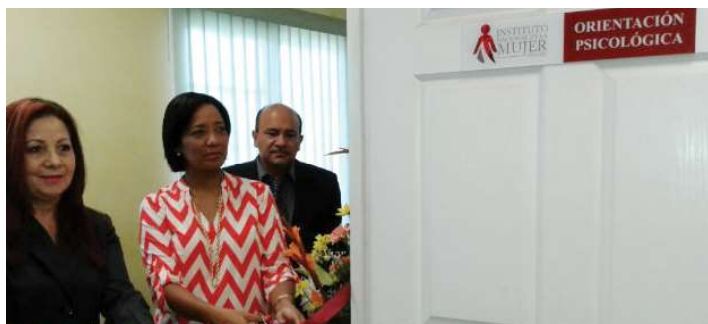
Inauguración de centro de atención integral del Inamu

Mediante el Programa Secopa, el Minseg facilita la adecuación de tres Centros de Atención Integral del Inamu en Colón, Panamá y San Miguelito. Como parte de la conmemoración del Día Internacional de la Eliminación de la Violencia contra la Mujer, se inaugura el Centro de San Miguelito en noviembre 2016. Adicionalmente, se elabora un protocolo de actuación de los Cinamu y la contratación del personal técnico para la atención en estas tres áreas geográficas hasta el año 2018.