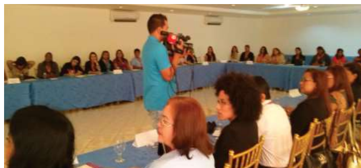
Capacitación para el fortalecimiento institucional del Inamu

Capacitaciones para el fortalecimiento institucional del Inamu. El Proyecto Secopa ejecuta en conjunto talleres de inducción para el nuevo personal de los Cinamu, formación de funcionarios/as del Inamu, Mides y Meduca para que capaciten a jóvenes y adolescentes de sus comunidades en la prevención de la violencia contra las mujeres. A la Red de Mecanismos Institucionales de las Mujeres se les capacita también para la elaboración de presupuestos sensibles al género en sus instituciones.