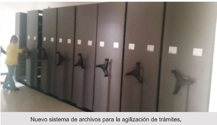
Nuevo sistema de archivos para la agilización de trámites.

La Diasp ha trabajado en el mejoramiento de las instalaciones del Departamento de Permiso de Armas de Fuego y Municiones en una apropiada armería, ventanillas de atención al público y sistema de archivos eficientes, ubicada en el edificio 746 en Balboa, Ancón.