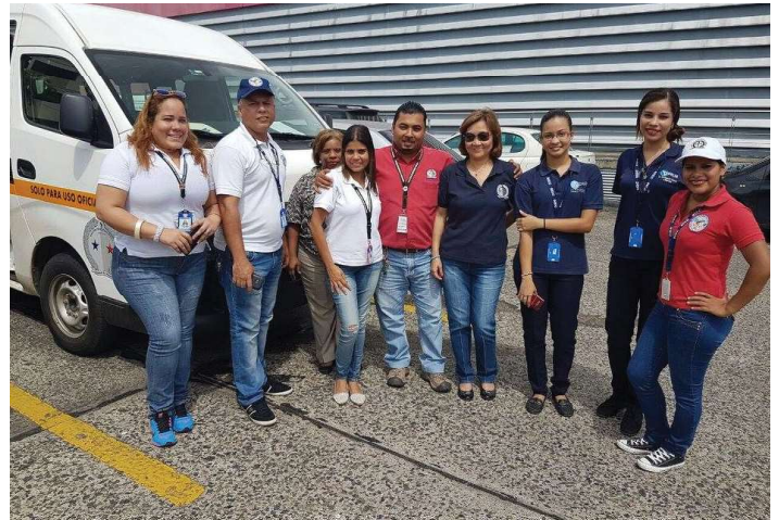
Inducción sobre la clasificación internacional y del delito. Unodc.

Participación en la inducción sobre la clasificación Internacional del Delito. Unodc, Infosegura, Pnud y Siec.