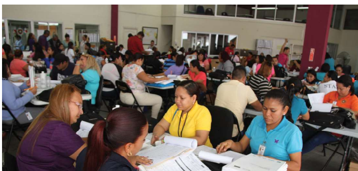
Funcionarios de Osegi apoyan al Siec para mejorar la calidad de los análisis

Apoyo al Sistema Nacional Integrado de Estadísticas Criminales, con la finalidad de mejorar la calidad de los análisis de las estadísticas criminales, para el diseño de políticas y programas en seguridad ciudadana.