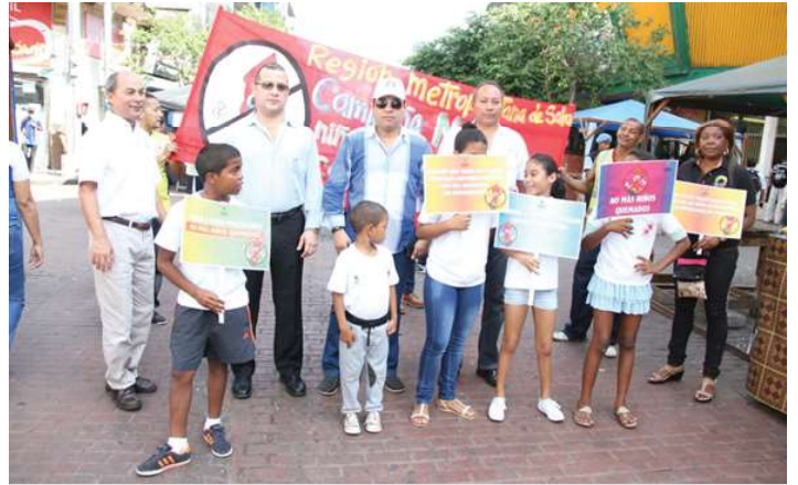
Campaña para el uso adecuado de los fuegos pirotécnicos.

Marcha, volanteo y banner con mensajes de prevención, en conjunto con otras instituciones en la Avenida Central.