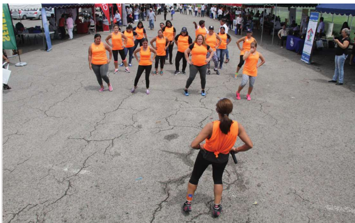
Dentro de las actividades del aniversario se realizó el Zumbalaton.