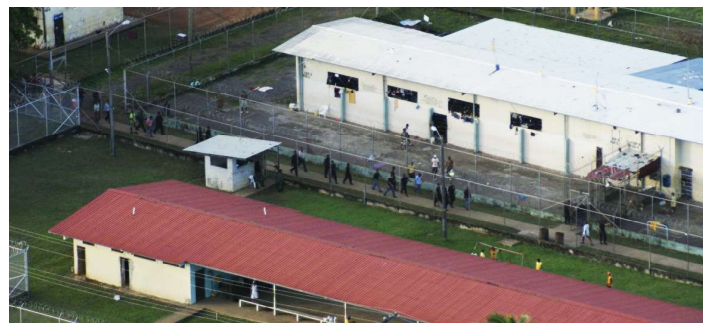
Se realizará un censo en los centros penitenciarios de Panamá.

En proceso de validación está el cuestionario que se utilizará para levantar el censo penitenciario, diseñado y aprobado.