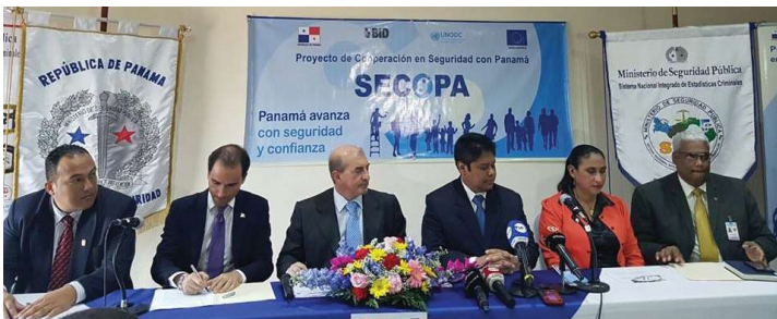
Promulgación de la Encuesta de Victimización. Más de 300 funcionarios laboraron en esta encuesta.

La realización de la Primera Encuesta de Victimización que se realiza en Panamá a nivel gubernamental, preparada a través del Programa de Seguridad y Cooperación (Secopa), Unión Europea, Contraloría y Minseg, se realizó del 3 al 30 de julio de 2016.