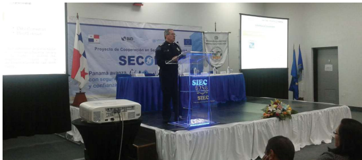
Participación de expositores internacionales en el V Congreso de Criminalidad.

Se realizó V Congreso de Criminalidad, denominado “Realidad de la Criminalidad Organizada en la Región y Valorización de las Políticas Públicas”, con la participación de expositores internacionales.