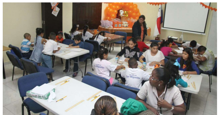
Concurso de dibujo por Vigésimo Quinto Aniversario.