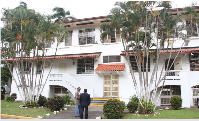
Dirección Institucional en Asuntos de Seguridad Pública

Su misión es controlar, registrar y regular las actividades operacionales desarrolladas por las empresas dedicadas al servicio de protección y vigilancia privada, así como aquellas que se dedican a la importación y comercialización de armas de fuego, municiones y materiales relacionados, explosivos, pirotécnica y otros.