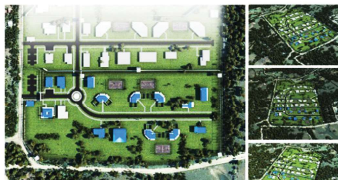
Proyección del Centro de Custodia de Menores y en conflicto con ley.

Proyección del Centro de Custodia de Menores y jóvenes en conflicto con la ley, ubicado en Paso Blanco, corregimiento de Pacora, provincia de Panamá.