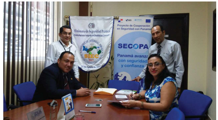
Entrega de Software al Siec, para ser entregado a 12 instituciones del Estado, que permitirá el análisis de la información criminal.

En total se logra la capacitación de 640 participantes miembros de las instituciones que forman parte del Siec y 20 actividades de capacitación.