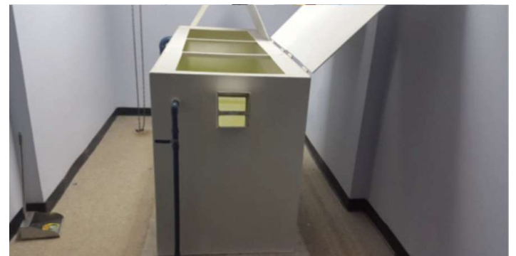
Cuarto para realizar las pruebas balísticas de las armas de fuego.

Esta institución tiene programado elaborar un diseño curricular para la formación y capacitación de los agentes de seguridad privada (con certificado de idoneidad), elevando su aprobación a través del Ministerio de Educación.