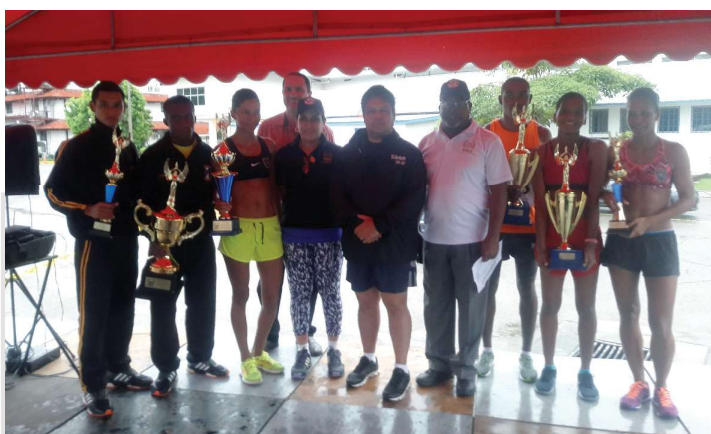
Participación del ministro Alexis Bethancourt Yau en las actividades de aniversario del Siec.

Se realizó V Congreso de Criminalidad, denominado “Realidad de la Criminalidad Organizada en la Región y Valorización de las Políticas Públicas”, con la participación de expositores internacionales.