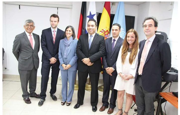
Curso de implementación del tratado de Comercio de Armas (Citca).

Se llevó a cabo el primer curso del tratado de implementación del Tratado de Comercio de Armas (Citca), dictado por el Centro Regional de las Naciones.