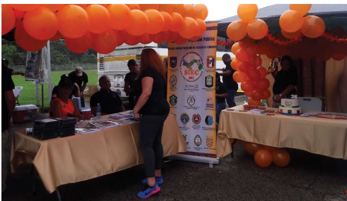
Mesa temática de violencia de género de la Red de Mujeres Sindicales.