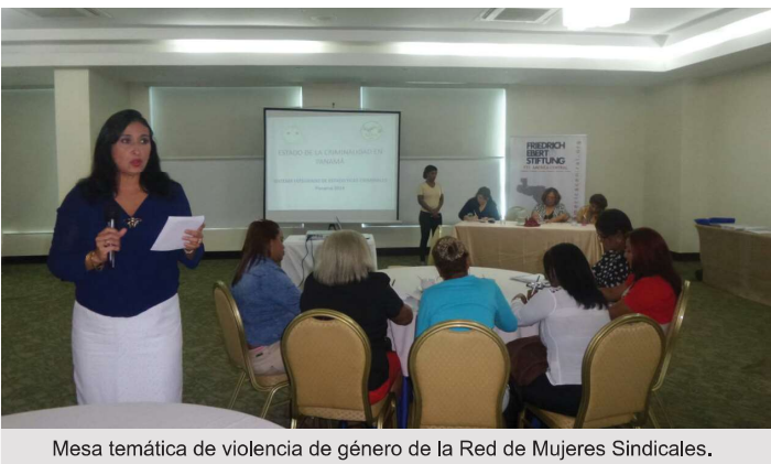
Mesa temática de violencia de género de la Red de Mujeres Sindicales.

El Siec celebró del su Vigésimo Quinto Aniversario trabajando por la seguridad de Panamá con diversas actividades.