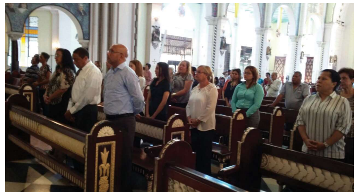
Misa de Acción de Gracia por el Vigésimo Quinto Aniversario.