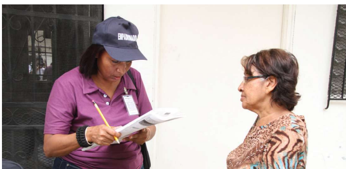
Funcionaria realizando encuesta de victimización a ciudadana

En julio de 2016 se realizó la I Encuesta Nacional de Victimización y Percepción de Seguridad Ciudadana en áreas urbanas, diseñado con los parámetros del cuestionario regional VICLAC-LACSI (Clasificación Internacional del Delito con Fines Estadísticos y las Encuestas de Victimización), permitiendo a Panamá posicionarse como el primer país en Latinoamérica que aplica el cuestionario regional estandarizado, para recopilar, difundir y analizar datos comparables de manera sistemática entre países.