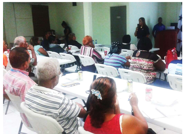
Participación en el cuarto encuentro educativo, dirigido a líderes.

Se supervisó y participó en el IV Encuentro Educativo, dirigido a los líderes organizados de la provincia de Colón, la actividad se desarrolló en las instalaciones del Ministerio Público.