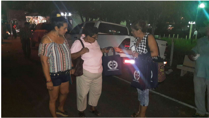
Funcionarios distribuyen volantes en Soná de Veraguas

Se realizó un volanteo en la provincia de Veraguas, donde se distribuyó trípticos con recomendaciones destinadas a la prevención de hechos delictivos. Este evento ferial se desarrolló en el distrito de Soná.