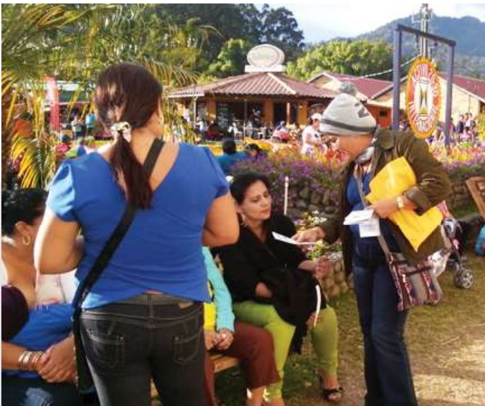
El personal capacitador suministro volantes en la feria de Boquete.

También se realizó un volanteo en la Feria de Las Flores y el Café, en la provincia de Chiriquí, distrito de Boquete. Alrededor de 900 panameños y extranjeros visitaron la feria y recibieron trípticos con información de cómo prevenir los hechos delictivos. A la vez se les instruyó en cómo organizarse en sus comunidades para prevenir las problemáticas en sus sectores.