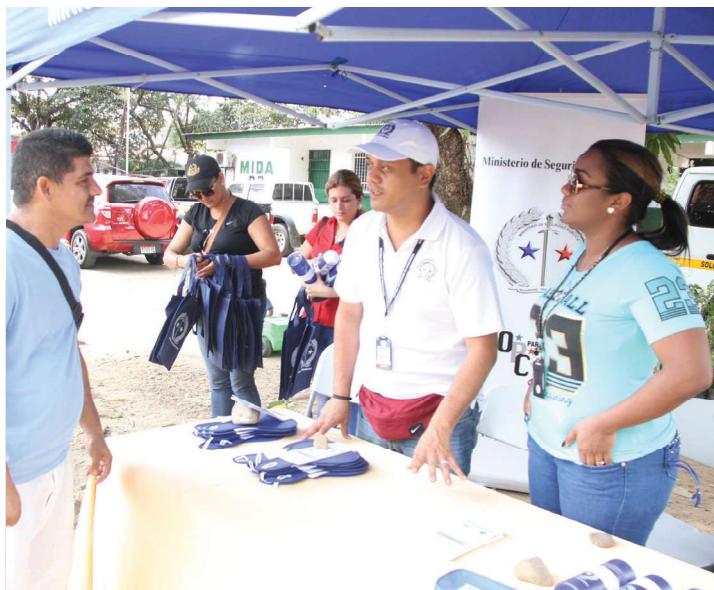
Stand de información para visitantes a la feria del IMA en San Martín.

Se asistió a la feria del Instituto de Mercado Agropecuario en conjunto con la Alcaldía de Panamá, en el corregimiento de San Martín, provincia de Panamá, en la cual se colocó un stand y se les informó a los moradores sobre las funciones del ministerio, los estamentos y la Oficina de Participación Ciudadana.