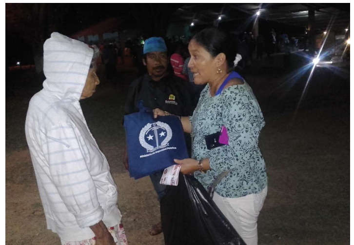
Distribución de volantes sobre medidas preventivas en Veraguas.

Se realizó una gira a la provincia de Veraguas, con el mismo objetivo de repartir volantes en materia preventiva a los residentes del lugar, ya que muchos desconocen cómo pueden evitar ser víctimas de robos entre otros. Es importante señalar que en el distrito de Santa Fe, residen muchos extranjeros y por ende es necesaria la información, tanto para los nacionales e internacionales, sobre la seguridad y medidas de prevención.