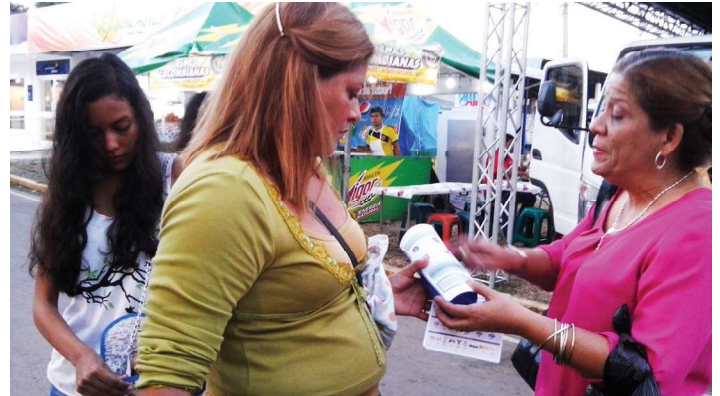
El personal capacitador suministro volantes en la feria de La Chorrera.

con el propósito de dar a conocer los programas preventivos que desarrollan activamente los estamentos de seguridad que conforman el MINSEG, para buscar el acercamiento y participación de la ciudadanía.