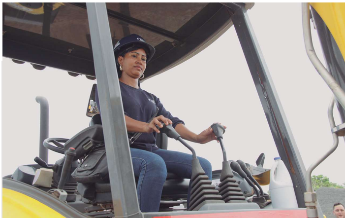
Participante del Probaseg laboran en un proyecto del MIVIOT

Con relación a la inserción laboral, el Probaseg ha logrado incluir socialmente a través del trabajo a 438 personas, que cumplieron con las fases. Estas personas se incluyen en diversos proyectos del Gobierno Nacional, a través del Miviot, Minseg y de organizaciones privadas como Odebrech, Minera Panamá, Fundación Constructora IBT, entre otras.