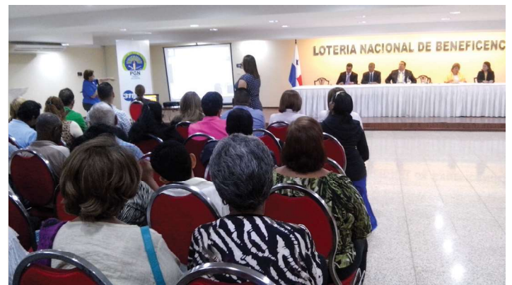
Primer encuentro de medidas de prevención sobre delitos sexuales

Se participó en el primer encuentro de capacitación y orientación referente a las medidas de prevención de delitos sexuales, medida de prevención contra la propiedad intelectual, estrategia de seguridad ciudadana y medidas de prevención referente a los delitos de drogas, ofrecida por Fiscales del Ministerio Público, dirigido a líderes comunitarios y unidades policiales.