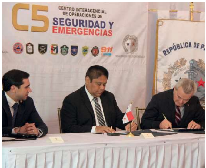
Firma del contrato para el establecimiento del Centro Interagencial de Operaciones de Seguridad y Emergencia “C5”.

El contrato del C5 se encuentra respaldado por un convenio marco de cooperación entre Panamá y Canadá que fue aprobado en enero del presente año mediante la Ley 14 de 2017, a fin de fortalecer las capacidades institucionales del Estado panameño, para la adquisición de bienes y servicios de seguridad y defensa, cumpliendo con los más altos estándares de transparencia y calidad.