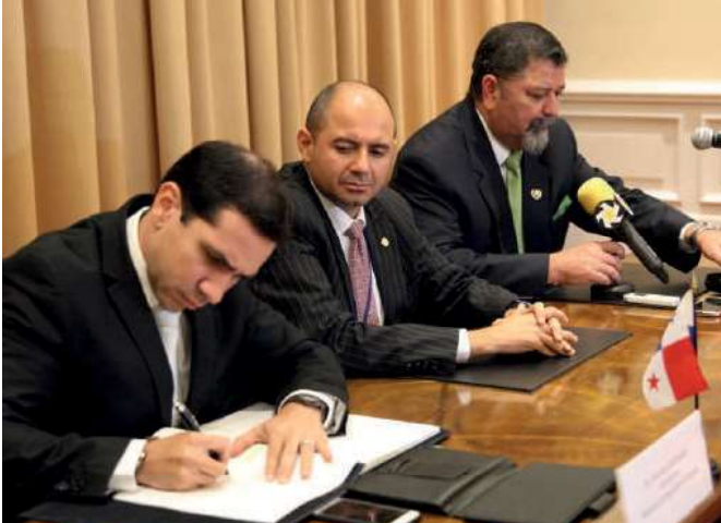
Acto de firma del Tratado de San José contra el tráfico ilícito de estupefacientes y sustancias en Costa Rica.

El jefe de la delegación panameña, añadió que para enfrentar problemas regionales y globales, se necesitan socios, amigos y aliados estratégicos regionales y globales.