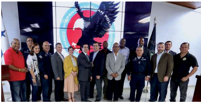
Acto de juramentación de nuevos miembros de Hapcoa celebrado en la sede de la Policía Nacional.

En seguimiento a dichos acuerdos, el día 4 de octubre, durante el acto de juramentación del viceministro Del Rosario como miembro de Hapcoa, anunció que a partir de enero de 2018 viajará a Estados Unidos la primera promoción de 10 oficiales panameños de la Policía Nacional y la Fuerza de Tarea Conjunta Águila a capacitarse en áreas de interés prioritario para Panamá. Adicionalmente, Del Rosario agregó que expertos miembros de Hapcoa vendrán a Panamá para dictar conferencias especializadas a los estamentos de seguridad durante el próximo año, en el marco de estos acuerdos de cooperación técnica.