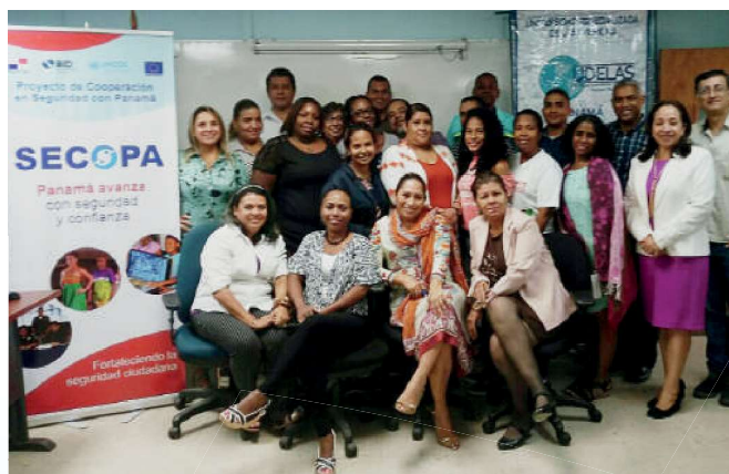
Diplomados de prevención social de las violencias.