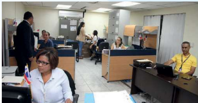
Personal de la Oficina de Seguridad Integral

En el ámbito local, esta Oficina ha coordinado la ejecución de programas de prevención dirigidos a jóvenes vulnerables, en comunidades de alto riesgo, con los municipios de Panamá, Colón, San Miguelito y David; mientras que en el ámbito internacional se ha coordinado con cooperantes tanto de agencias de cooperación como organizaciones multilaterales, embajadas y organizaciones no gubernamentales.