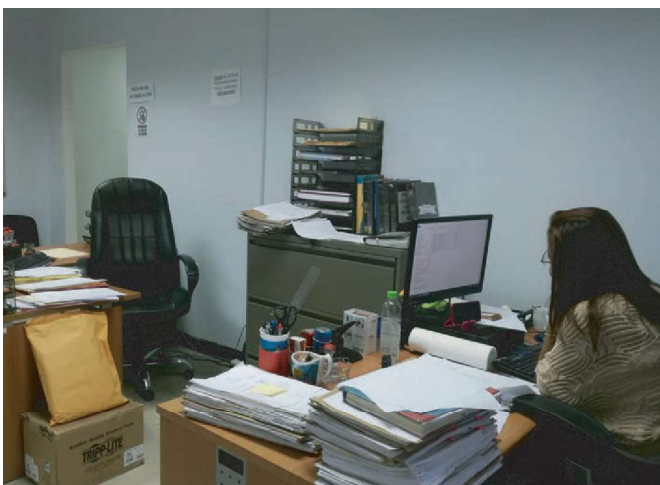
Actualmente los colaboradores de la oficina de Legal están a la espera de la remodelación y acondicionamiento.