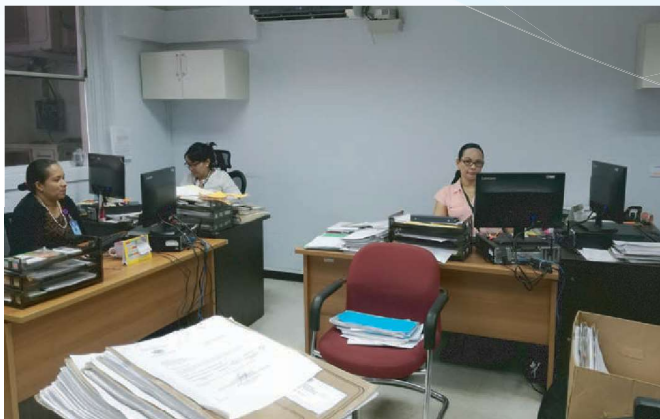
Imagen de la actual oficina de Asesoría Legal

El nuevo mobiliario estará compuesto por modulares para los abogados, reubicación de la oficina secretaría; de esta manera lograremos organizar los cubículos para los servidores públicos que colaboran con la Dirección, así como también los archivos.