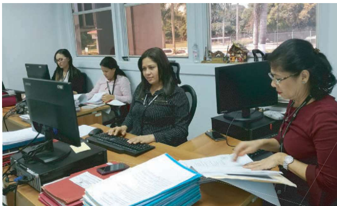
Funcionarios de la Oficina de Asesoría Legal