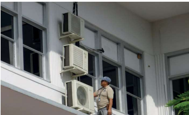
Mantenimiento de unidades de aires acondicionados.