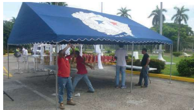
Apoyo en actividades de las direcciones y dependencias en la organización y montaje de equipos y materiales que se requieren.