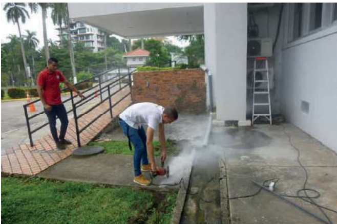
Instalación de luces en el Edificio 1220 de la sede del Minseg