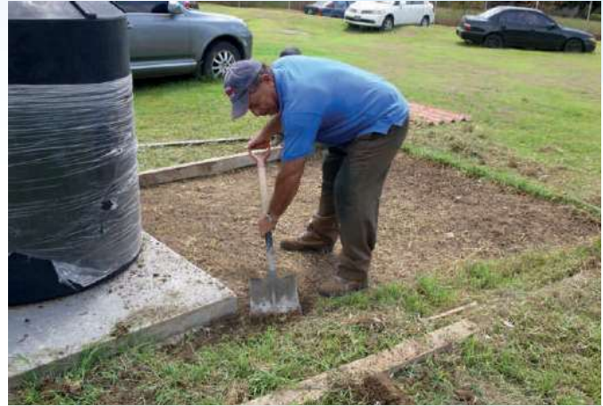
Mejoras y adecuaciones de la cocina y el rancho de la sede.

Estas labores son supervisadas por la jefa del Departamento, teniendo a su cargo un total de 35 funcionarios, entre los cuales, cuentan con 16 trabajadoras manuales asignadas a las labores de aseo de la sede y dependencias, personal técnico en electricidad, refrigeración, albañiles y personal de apoyo de los estamentos de seguridad, de igual forma personal administrativo que maneja las cuentas de los servicios básicos.