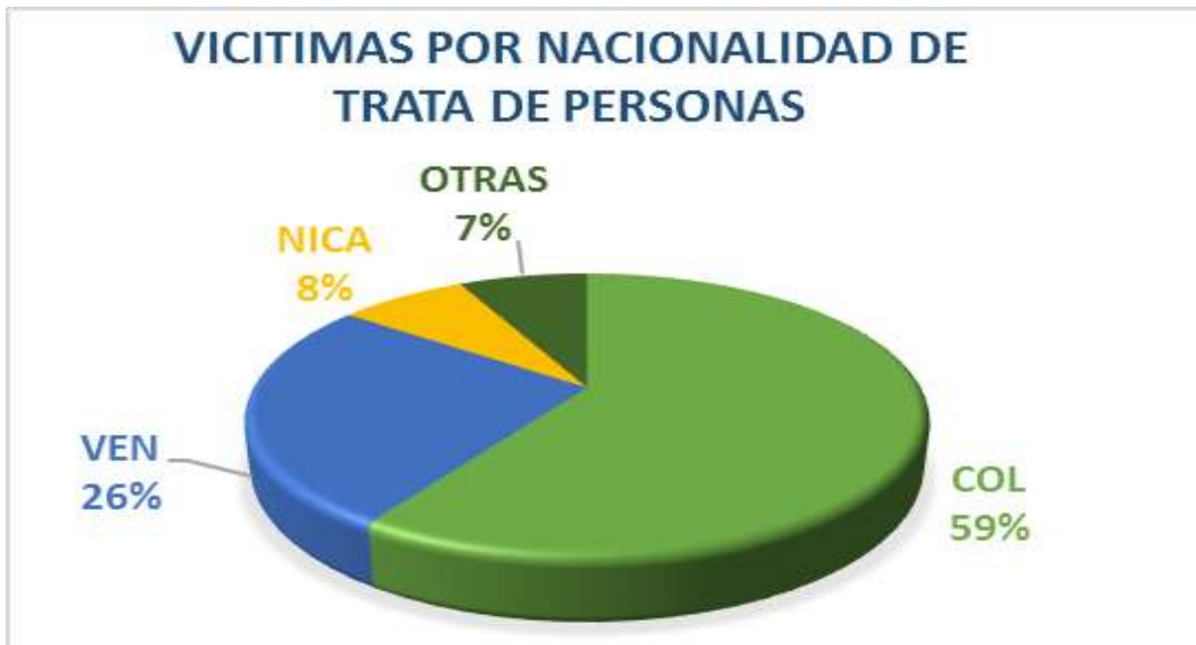
Gráfico 1. Porcentaje de víctimas según nacionalidad, a enero 2019.